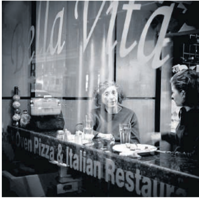
New York, 2010: 'Nét Anne Frank, als ze was blijven leven.'