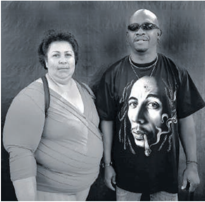
Rotterdam, 2007: carnaval.