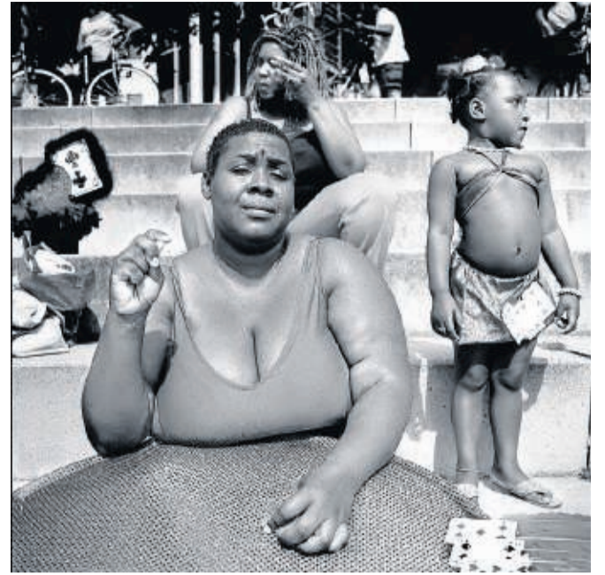
Rotterdam, 2008: carnaval.