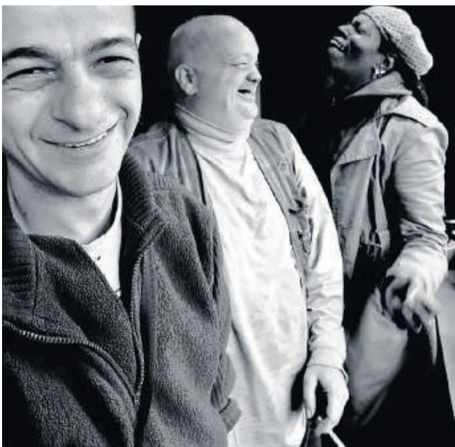
Amersfoort, 2010: 'Coffeeshop waar ik wiet haal, tegen pijn.'